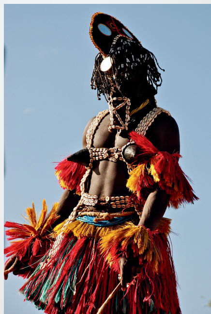
Momento di una festa di inaugurazione di una scuola nel Mali