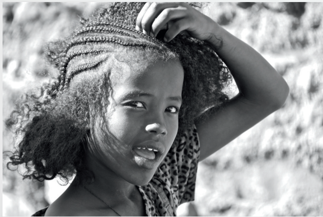
Treccine - Etiopia -