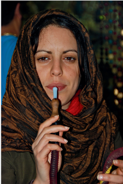
Donna iraniana - Iran -