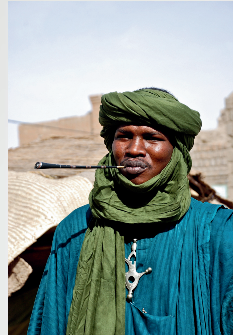
Tuareg - Etiopia -