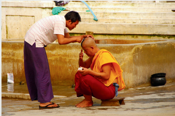
La rasatura - Birmania -