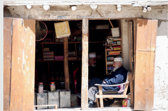
La bottega - Ladakh -