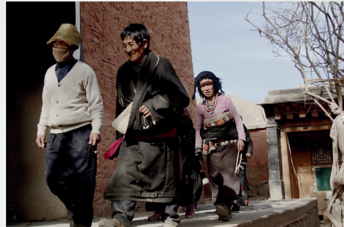
La preghiera - Tibet -