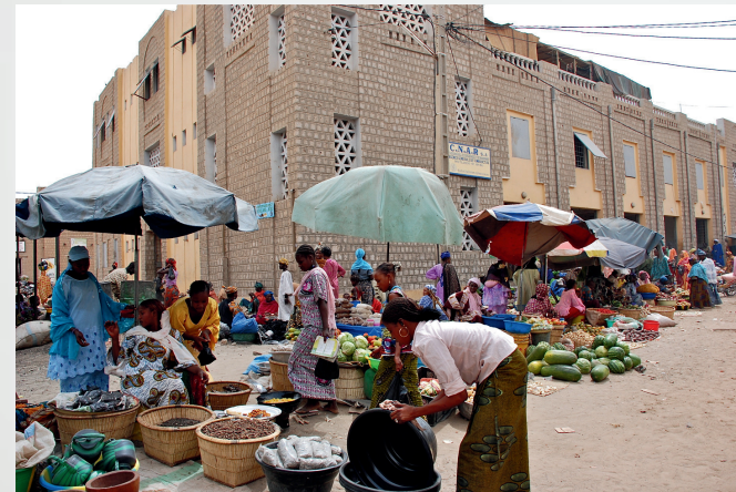
Mercato del Mali