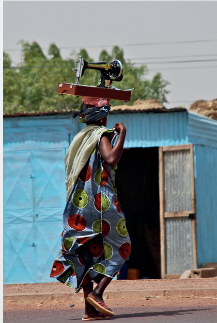
La sarta - Mali -