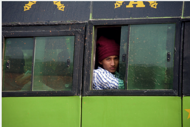
Katmandu - Nepal -