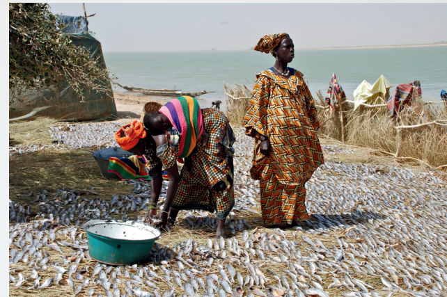
Essiccatura del pesce - Mali -