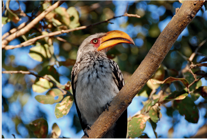
Uccello del Bucero