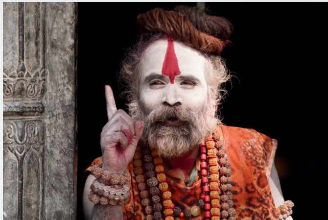
Santone a Katmandu - Nepal -