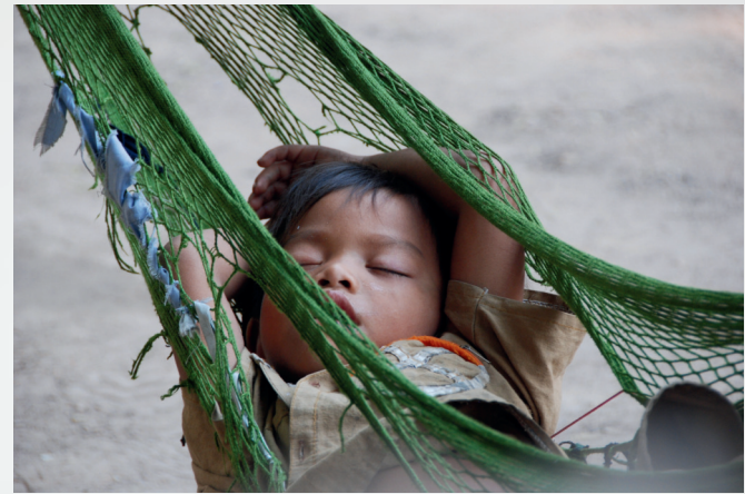
La siesta - Vietnam -