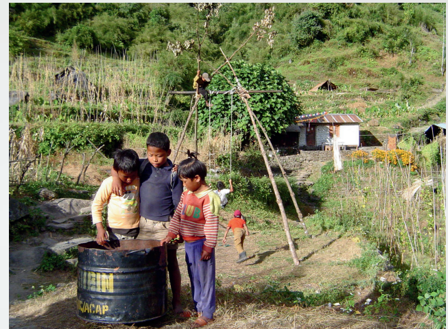
Lungo i sentieri del Nepal - Nepal -