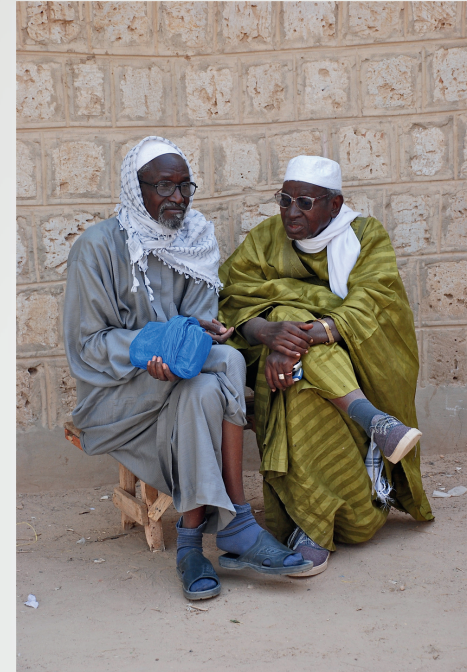
Uomini del Mali